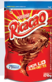
RICACAO *70 DOYPACK 170 GR