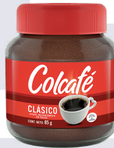
COLCAFE *24 UNI 85 GR