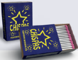
FOSFOROS CHISPAS *50 DISP. 20 UNI