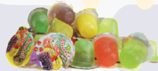
GOMA MINI JELLY *600 UNI