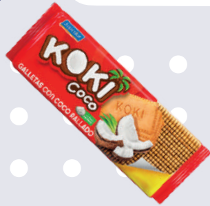
GALLETA KOKI TACO *24 PAQ. 210 GR