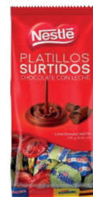
PLATILLOS SURTIDOS *30 PAQ. 250 GR