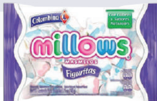
MASMELO *12 PAQ. 145 GR