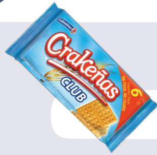
GALLETA CRAKEÑA CLUB INDIVIDUAL *24 PAQ.