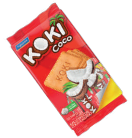
GALLETA KOKI *9 PAQ. *18 UNI