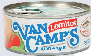
ATÚN VANCAMP'S AGUA *48 UNI 184 GR