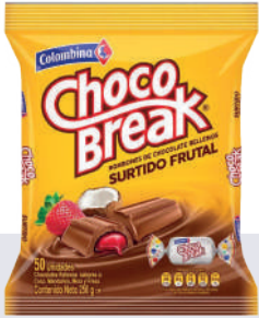
CHOCO BREAK *18 PAQ. *50 UNI 250 GR