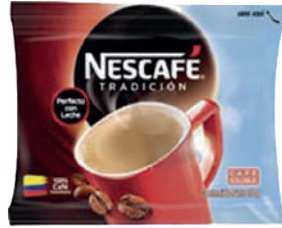
NESCAFÉ *25 RISTRA *17 UNI 10 GR