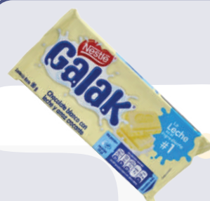
GALAK *6 DISP. *12 UNI 100 GR