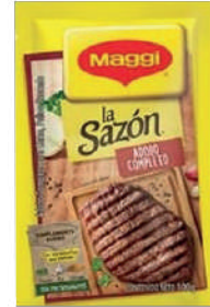
LA SAZON *20 RISTRA *14 UNI 30 GR