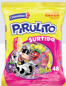
BBB PIRULITO *16 PAQ. *48 UNI