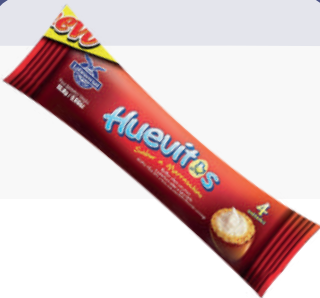
HUEVITO FLOW PACK *4 PAQ. 100 UNI*4