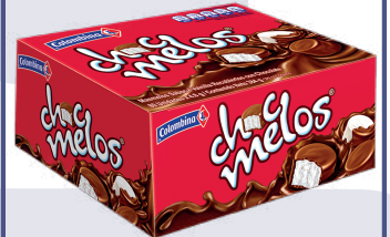
CHOCMELO *80 UNI DISP. 384 GR