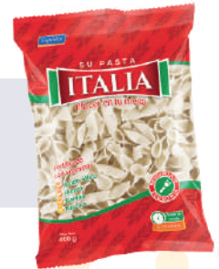
FIDEO ITALIA *25 PAQ. 400 GR