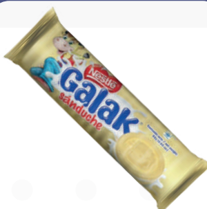
GALAK SANDUCHE *72 UNI 87,5 GR