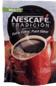
NESCAFÉ *40 DOYPACK *50 GR