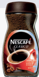
NESCAFÉ *12 UNI 200 GR