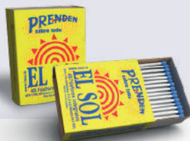
FOSFOROS EL SOL *50 DISP. 20 UNI