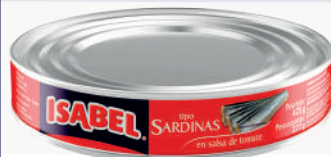
SARDINA ISABEL SALSA DE TOMATE *24 UNI 425 GR