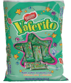
VAFERITO *30 PAQ. *56 UNI 500 GR