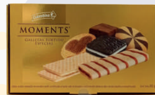
GALLETA MOMENTS *12 UNI 265 GR