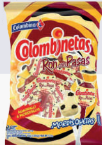
BBB RON PASAS *15 PAQ. *24 UNI