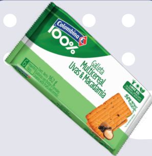
GALLETA MULTICEREAL *20 PAQ. *6 UNI