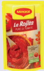
LA ROJITA *8 DISP. *12 UNI 113 GR