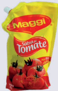
SALSA DE TOMATE *24 UNI 550 GR