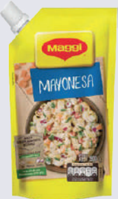
MAYONESA *14 UNI 900GR