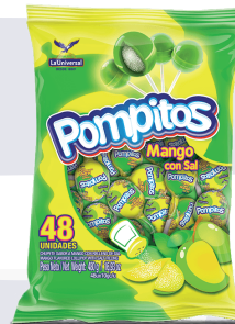
BBB POMPITO *16 PAQ. *48 UNI