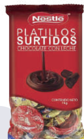
PLATILLOS SURTIDOS *7 PAQ. 1 KG