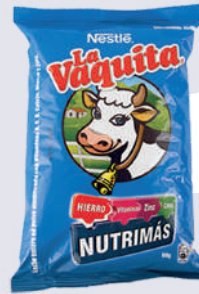
LA VAQUITA *115 UNI *100 GR