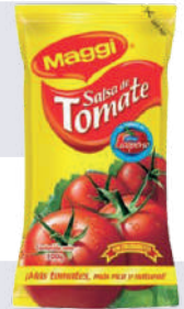
SALSA DE TOMATE *20 RISTRA *14 UNI 30 GR