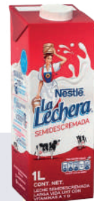
LA LECHERA SEMIDESCREMADA *12 UNI 1 LIT.