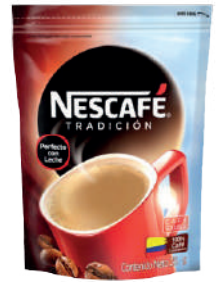
NESCAFÉ *75 DOYPACK *25 GR