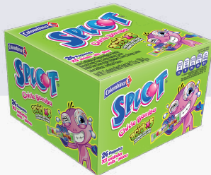
CHICLE SPLOT (MENTA-ACIDO) *24 DISP. *18 UNI