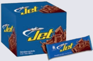
JET *24 DISP. *18 UNI 26 GR