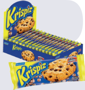
GALLETA KRISPIZ *10 DISP. *12 UNI 456 GR