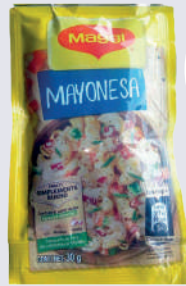
MAYONESA *20 RISTRA *14 UNI 30 GR