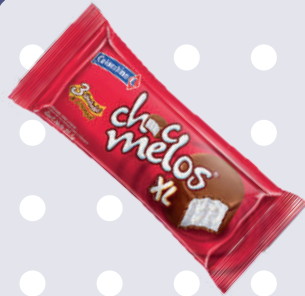
CHOCMELO *8 DISP. *15 PAQ.*3 UNI