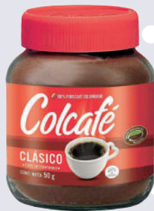
COLCAFE *24 UNI 50 GR