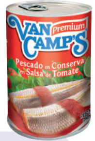
TINAPA VANCAMP'S EN SALSA DE TOMATE *50 UNI 170 GR