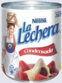
LECHE CONDENSADA *48 UNI 395 GR