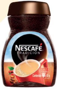
NESCAFÉ *24 UNI 50 GR