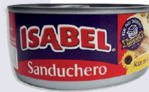
ATÚN ISABEL SANDUCHE- RO (NO LITOGRAFIADO) *48 UNI 160 GR