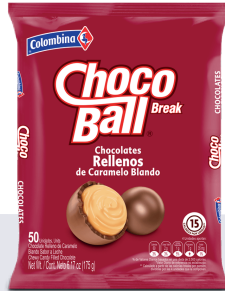
CHOCO BREAK BALL *18 PAQ. 50 UNI 175 GR