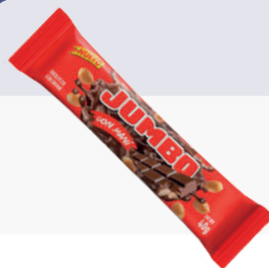
JUMBO MANÍ *24 DISP. *24 UNI