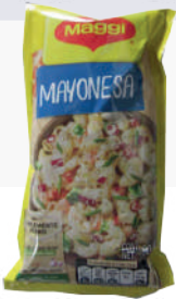
MAYONESA *6 DISP. 16 UNI. 90 GR