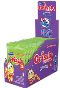
GOMAS GRISSLY GUSANOS *12 DISP.