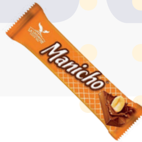
MANICHO *6 DISP *24 UNI 28 GR