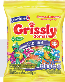
GOMAS GRISSLY *24 PAQ. 90 GR