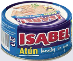
ATÚN ISABEL AGUA *48 UNI 160GR