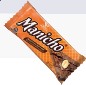
MANICHO *6 DISP * 10 UNI 100 GR