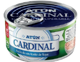
ATÚN CARDINAL RALLADO *48 UNI