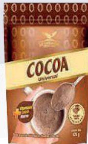
COCOA *27 DOYPACK 420 GR