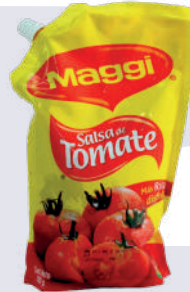
SALSA DE TOMATE *12 UNI 1KG