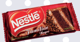
CHOCOLATE NESTLÉ FAMILIAR *6 DISP. 100 GR