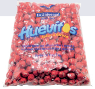
HUEVITO A GRANEL *7 PAQ. 400 UNI