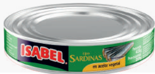
SARDINA ISABEL EN ACEITE *24 UNI 425 GR