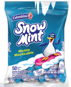
CAR. SNOW MINT *16 PAQ. 100 UN