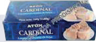
ATÚN CARDINAL LOMITOS BIPAK *30 DISP. *160 GR