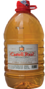
VINO CASTELL REAL *6 GAL 5 LIT.