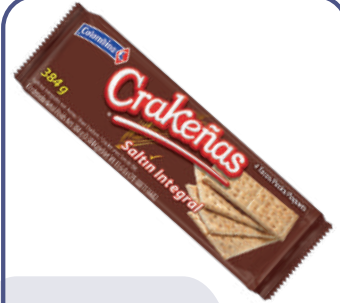
GALLETA CRAKEÑAS INTEGRAL *24 PAQ.