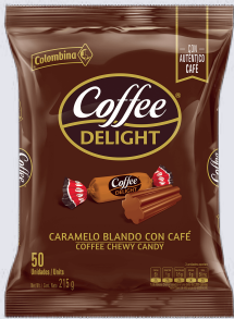
CAR. COFFE DELIG *18 PAQ. *100 UNI