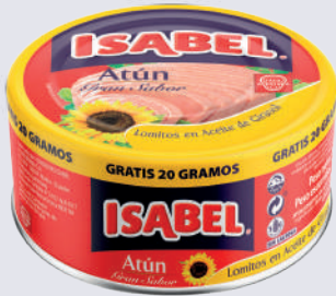
ATÚN ISABEL GI *48 UNI 180 GR