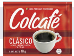
COLCAFE *50 RISTRA *12 UNI 10 GR