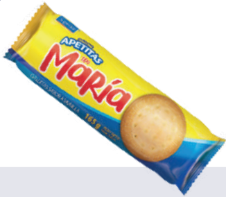
GALLETA APETITAS MARIA *30 UNI 165 GR