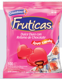
CAR. FRUTICAS LOVE *16 PAQ. 100 UNI