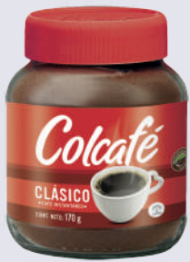
COLCAFE *24 UNI 170 GR