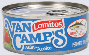
ATÚN VANCAMP'S *48 UNI 184 G