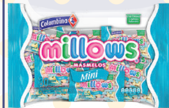
MASMELO MINI *5 PAQ. *30 UNI