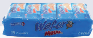
GALLETA WAFER MUU *24 PAQ. *15 UNI