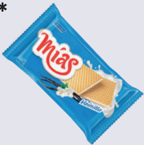
GALLETA MIAS GRANDE *36 UNI 190 GR