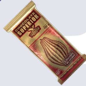
CHOCOLATE SUPERIOR *3 DISP. *22 UNI