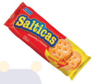
GALLETA SALTICA *48 UNI

*Galletas más de 190 gr Cuenta con sabores como original, limón, fresa, vainilla, naranja, chocolate.