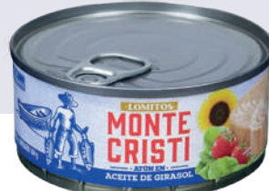
ATÚN VANCAMP'S MONTECRISTI *48 UNI 160 GR