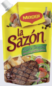
LA SAZON *24 UNI 550 GR