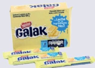
GALAK *28 DISP. *21 UNI 20 GR