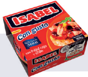
ATÚN ISABEL CON FREJOL *48 UNI 160 GR