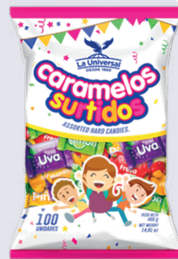
CAR. SURTIDO DURO *30 PAQ. 100 UNI