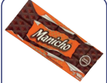
MANICHO EDICIÓN ESPECIAL *12 DISP 400G