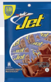
JET *30 PAQ. *50 UNI 6 GR