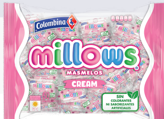
MASMELO INDIVIDUAL *8 PAQ. *50 UNI