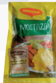
MOSTAZA *20 RISTRA *14 UNI 30 GR