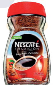
NESCAFÉ *24 UNI 100 GR