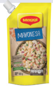
MAYONESA *42 UNI 200 GR