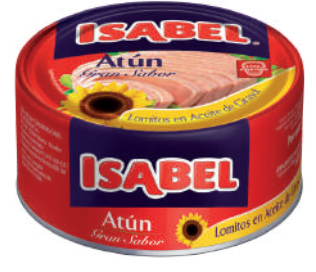
ATÚN ISABEL GI *48 UNI 160 GR (CAJA ROJA Y CAJA AZUL)