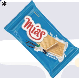
GALLETA MIAS PEQUEÑA *36 UNI 84 GR