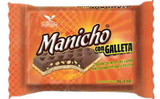
MANICHO GALLETA *20 DISP * 12 UNI