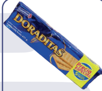
GALLETA CRAKEÑAS DORADITAS *24 PAQ.