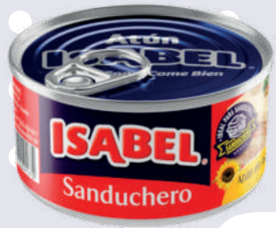
ATÚN ISABEL SANDU- CHERO (LITOGRAFIADO) *48 UNI 160 GR