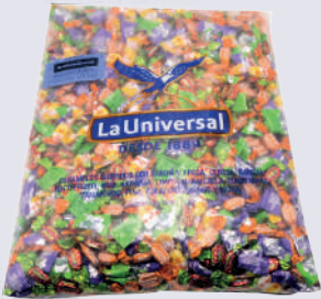
CAR. DURO UNIVERSAL 5KG (APROX. 4200 UN)