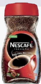
NESCAFÉ *12 UNI 160 GR