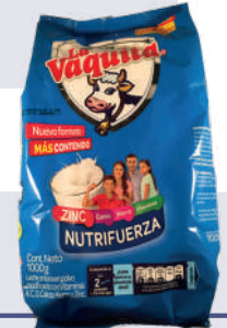
LA VAQUITA *13 U *1KG