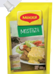
MOSTAZA *42 UNI 200 GR