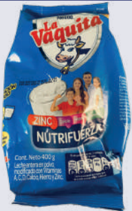
LA VAQUITA *30 UNI *400 GR