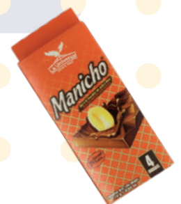
MANICHO *72 DISP *4 UNI 28 GR