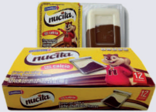
NUCITA *24 DISP. *12 UNI 168 GR