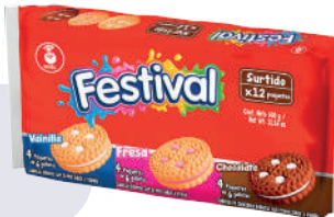
GALLETA FESTIVAL *24 PAQ. *12 UNI