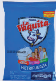
LA VAQUITA *56 UNI *200 GR