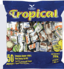
CAR. TROPICAL *40 PAQ. 50 UNI