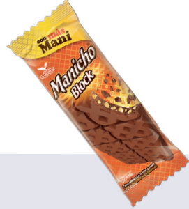
MANICHO BLOCK *6 DISP 150 GR