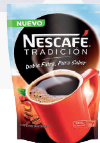
NESCAFÉ *20 DOYPACK *170 GR