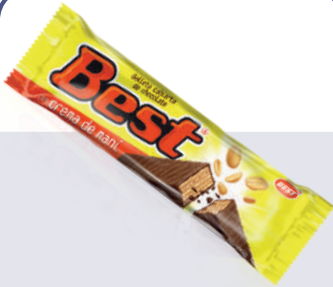
GALLETA BEST MANI *48 PAQ. *5 UNI