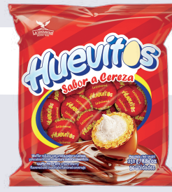
HUEVITO *48 PAQ. 265 GR