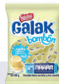
GALAK BOMBÓN *120 PAQ. 100 GR