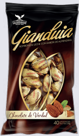
GIANDUIA *36 PAQ. 200GR