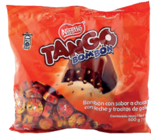
TANGO BOMBÓN *20 PAQ. 437,5 GR