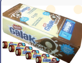
GALAK TUBITO *32 DISP. *30 UNI 16 GR