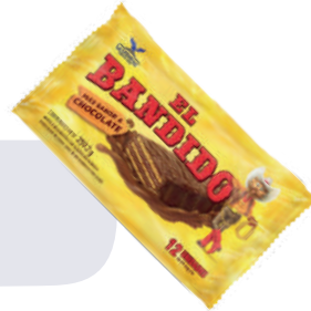
BANDIDO *16 PAQ. *12 UNI