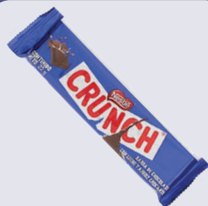
CRUNCH *24 DISP. *21 UNI 23 GR