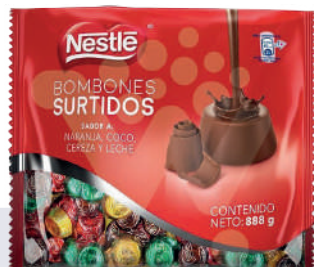
BONBONES SURTIDOS *12 PAQ. 880 GR