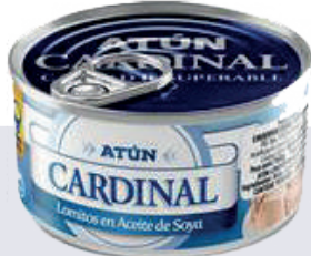
ATÚN CARDINAL LOMITOS *48 UNI 160 GR