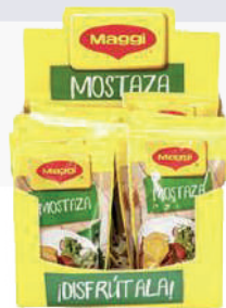
MOSTAZA *14 DISP 100 GR