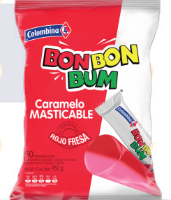
BBB MASTICABLE *16 PAQ. *50 UNI

*Bon Bon Bum Cuenta con ocho sabores como fresa, surtido, surtido tropical, mango, maracuyá, cereza, mystery, sandía.