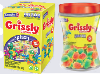
GOMAS GRISSLY SPLASH *8 DISP. *100 UNI