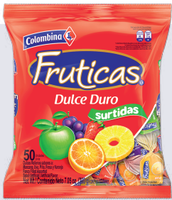
CAR. FRUTICAS ECUADOR *16 PAQ. 100 UNI