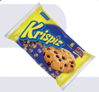
GALLETA KRISPIZ *10 PAQ. *6 UNI 228GR