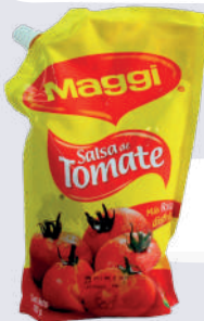
SALSA DE TOMATE *42 UNI 200 GR