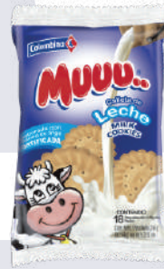
GALLETA MUU LECHE *30 PAQ.