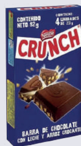
CRUNCH TIRA *40 DISP. *4 UNI 23 GR