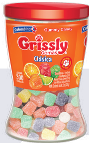
GOMA GRISSLY CLÁSICA *8 DISP. * 300 UNI