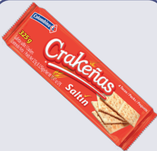
GALLETA CRAKEÑAS SALTIN *24 PAQ.