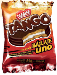
TANGO GRANEL *100 UNI