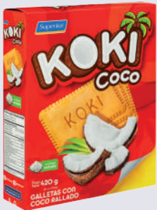
GALLETA KOKI CAJA *21 DISP. 420 GR