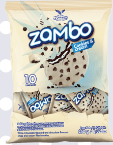
ZAMBO COOKIES *32 PAQ. 10 UNI