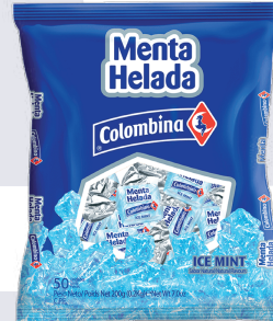
MENTA HELADA *18 PAQ. 100 UN