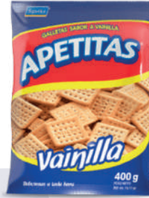
GALLETA APETITAS VAINILLA *10 PAQ. 400 GR