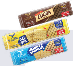
GALLETA UNIVERSAL TACO *24 UNI