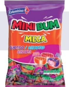
MINI BUM SURTIDO *16 PAQ. 100 UNI