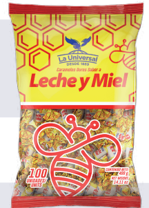
CAR. LECHE Y MIEL *24 PAQ 100 UNI