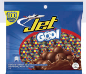
JET GOOL *12 PAQ. 100 UNI