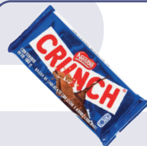
CRUNCH *6 DISP. *12 UNI 100 GR