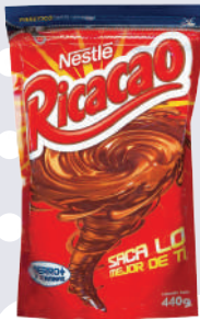
RICACAO *27 DOYPACK 440 GR