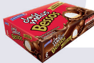
CHOCMELO BESOS *18 DISP. *6 UNI 90 GR