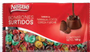
BONBONES SURTIDOS *67 PAQ. 180 GR