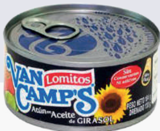
ATÚN VANCAMP'S *24 UNI 354 GR