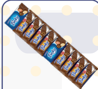
PONKY *24 RISTRA *8 UNI (VAINILLA CHOCO CAMELO, FRESAS CON CREMA)