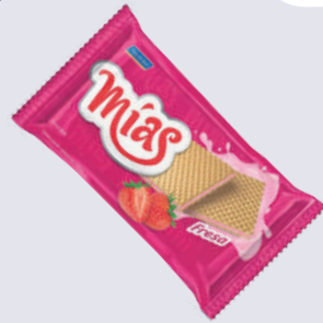
GALLETA MIAS MEDIANA *36 UNI 108 GR