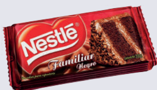
CHOCOLATE NESTLÉ FAMILIAR *44 UNI 200 GR