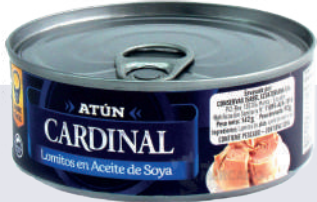
ATÚN CARDINAL LOMITOS *48 UNI 142 GR