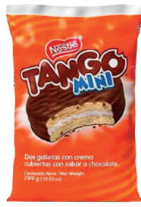
MINI TANGO *20 PAQ. *23 UNI 300 GR