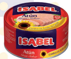
ATÚN ISABEL *24 UNI 354 GR