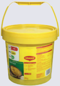
MOSTAZA BALDE 4KG