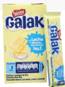
GALAK TIRA *46 DISP. *4 UNI 20 GR