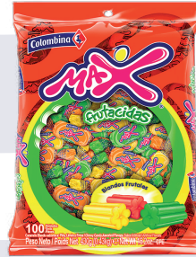
CAR. MAX FRUTACIDAS *16 PAQ. 100 UNI