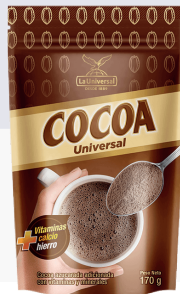
COCOA *20 DOYPACK 320 GR