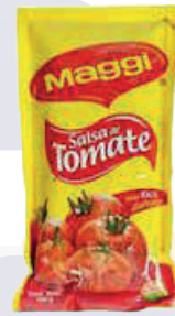
SALSA DE TOMATE *6 DISP. 14 UNI 100 GR