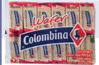
GALLETA WAFER *24 PAQ. *12 UNI