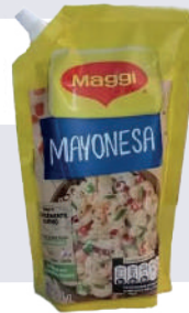
MAYONESA *33 UNI 400 GR