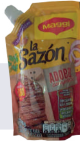
LA SAZON *55 U *150 GR