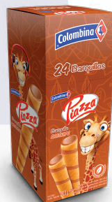
PIAZZA *12 DISP. *24 UNI