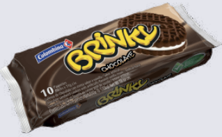
GALLETA BRINKY *24 PAQ. *12 UNI