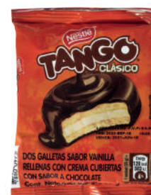
TANGO *21 PAQ. *28 UNI 625 GR