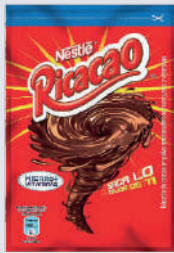
RICACAO *22 RISTRA *15 UNI 25GR