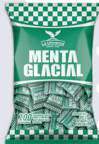
CAR. MENTA GLACIAL *30 PAQ. 100 UNI