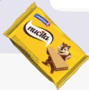
GALLETA WAFER NUCITA *24 PAQ. *8 UNI