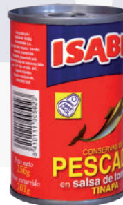
TINAPA ISABEL *50 UNI 156 GR