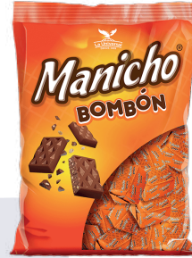
MANICHO BOMBÓN *16 PAQ * 100 UNI 380 GR