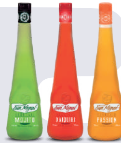
COCKTAIL SAN MIGUEL *12 UNI 750 ML