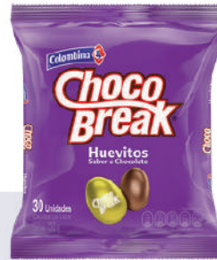
CHOCO BREAK HUEVITO *20 PAQ. *30 UNI 150 GR