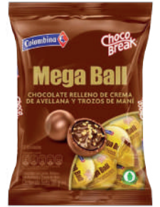
CHOCO BREAK MEGA BALL *24 PAQ. 12 UNI 186 GR