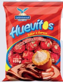
HUEVITO *30 PAQ. 425 GR