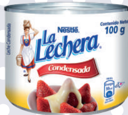
LECHE CONDESANDA *96 UNI 100 GR