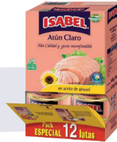
ATÚN ISABEL DISPENSADOR *5 DISP. *12 UNI 80 GR