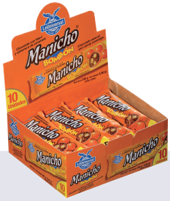
MANICHO BALL *36 DISP *12 UNI 24 GR