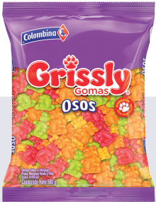
GOMA GRISSLY *12 PAQ. 500 GR