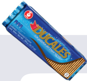
GALLETA DUCALES *24 PAQ.