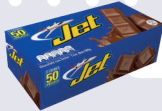
JET *30 DISP. *50 UNI 12 GR