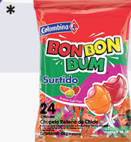
BBB SURT *16 PAQ. *24 UNI