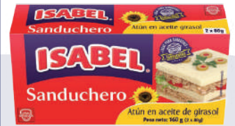
ATÚN ISABEL SANDUCHERO BIPACK *30 DISP. 160 GR